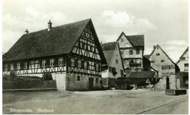
Das alte Rathaus / La mairie ancienne qui n'existe plus

la place d'une maison à colombages, car le bâtiment précédent était devenu trop petit pour les tâches à accomplir dans une commune en pleine croissance. Les formes cubiques ainsi que les matériaux utilisés à l'intérieur, à savoir le béton, le cuivre et le chêne massif, correspondent au style de l'époque et reflètent la confiance en soi de la commune en plein essor.