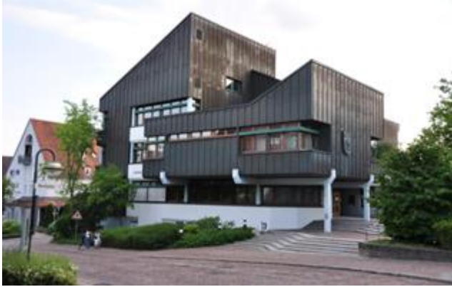
Das neue Rathaus / La mairie moderne

Fachwerkhauses errichtet wurde, da das bisherige Gebäude für die Aufgaben in der wachsenden Gemeinde zu klein geworden war. Die kubischen Formen sowie die Materialien Beton, Kupfer und massive Eiche im Inneren entsprechen dem Stil der damaligen Zeit und spiegeln das Selbstbewusstsein der aufstrebenden Gemeinde.