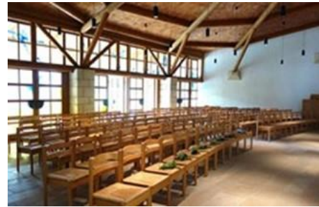
Aussegnungshalle beim neuen Friedhof/ La nouvelle salle d'inhumation du nouveau cimetière

D'un point de vue historique, l'ancien cimetière est également important. Au début, tous les habitants de Pliezhausen y étaient enterrés, mais il était devenu trop petit en raison de la taille de Pliezhausen et a été abandonné. Il a été remplacé par un nouveau cimetière à la périphérie de Pliezhausen, qui dispose d'une grande salle d'inhumation et d'une infrastructure plus moderne.