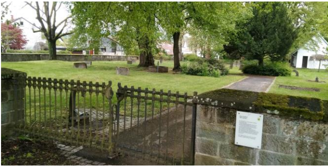
Der alte Friedhof / Le vieux cimetière

Historisch gesehen bedeutsam ist auch der alte Friedhof, auf dem zunächst immer alle Pliezhäuser beerdigt wurden, der aber auf Grund der zwischenzeitlichen Größe von Pliezhausen zu klein geworden war und aufgegeben wurde. Er wurde abgelöst von einer neuen Ruhestätte am Ortsrand von Pliezhausen, die über ein große Aussegnungshalle und modernere Infrastruktur verfügt.