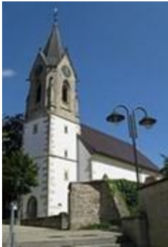
St. Martins-Kirche & St. Franziskus-Kirche

Kirchenschiffes, das den römischen Gott des Handels Merkur in liegender Position darstellt. An der Südseite der Kirche befindet sich ein Relief des Heiligen Martins, nach dem die Kirche benannt wurde.